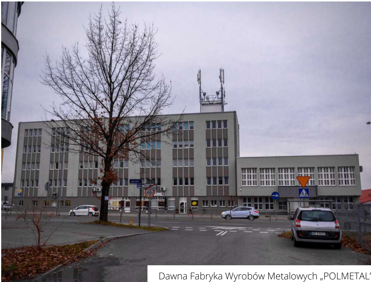
Dawna Fabryka Wyrobów Metalowych „POLMETAL”

Zakład na przestrzeni lat zajmował się produkcją produktów z różnych branż (naczynia emaliowane, Kuchenki, etc.) tak więc może być Wam on znany pod którąś z tych nazw: „Unja”, „Syrena”, „Błaszanka”, „Polmetal”, czy Fabryka Kuchni „Acanta”. Fabryka mieściła się przy ul. 1905 Roku 26/28 (dawniej Marywilska 39).