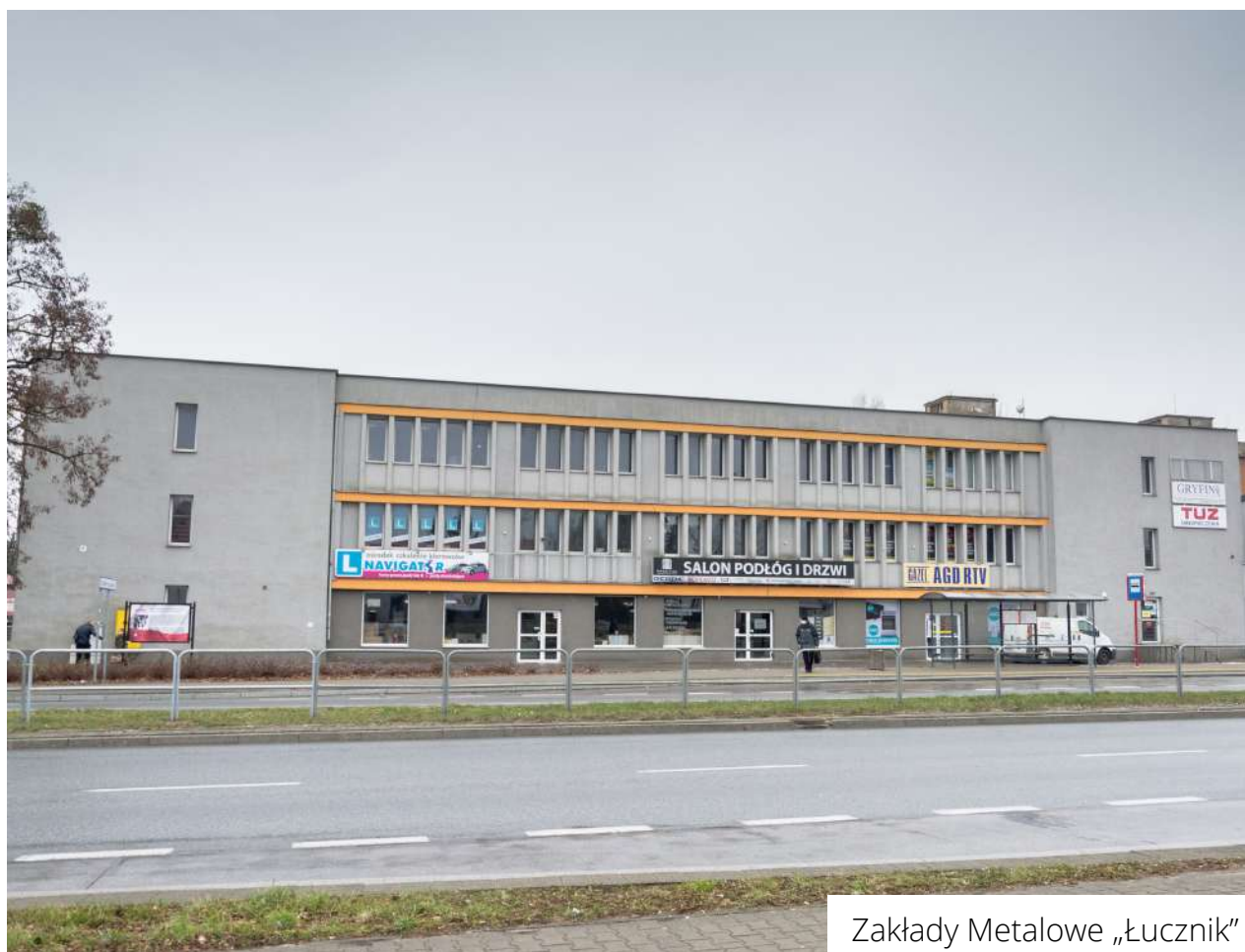
Zakłady Metalowe „Łucznik”

ul. 1905 roku / Młodzianowska / Przemysłowa